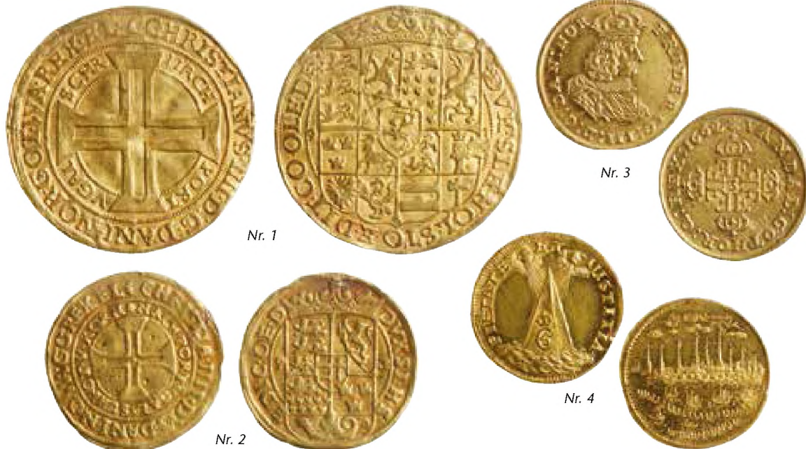
Fig. 1-7 De indkøbte mønter 2024 Vist i ca. 120%

2011 måtte samlingen flyttes. Siden da har det ikke været muligt at besøge den.